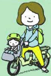
パートタイム勤務